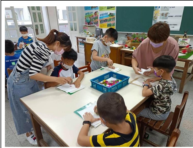
關主示範製作流程(低年級)