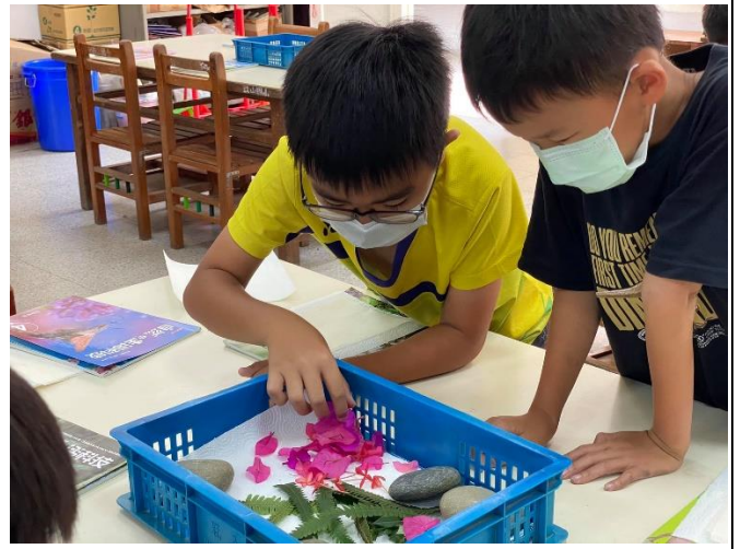
學生實地體驗-選擇素材 (中年級)