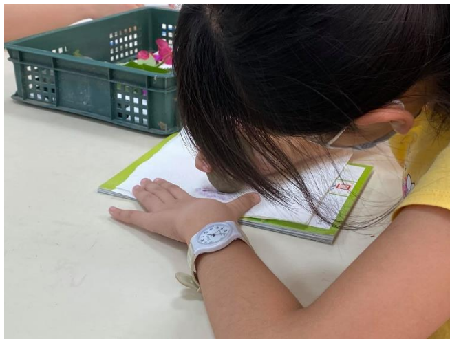
學生實地體驗-輕敲植物素材(中年級)