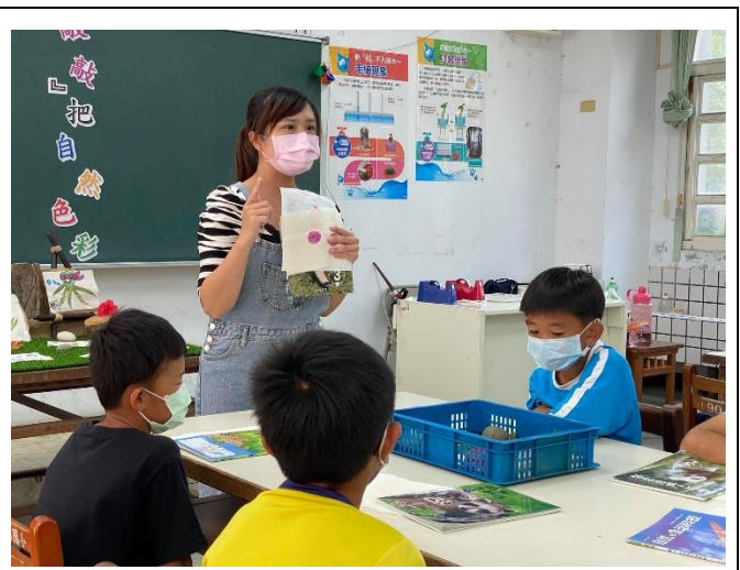
園遊會關主解說闖關規則與自然原理