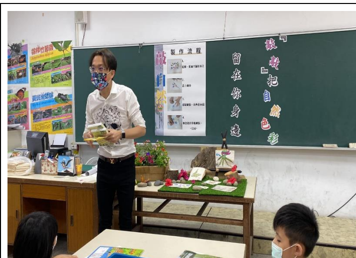
活動召集人(校長)開場